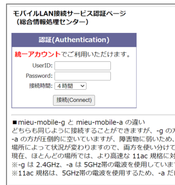
■モバイルLAN認証ページ