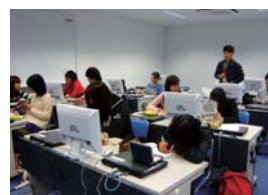
PC語学演習室での授業