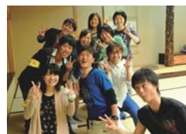
親睦が深まる宿泊研修