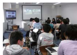
米国の大学との遠隔授業