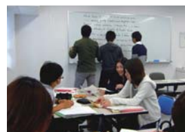
授業風景:みんなで考える

異文化理解の分野では、異文化コミュニケーション全般の基礎知識を習得すると共に、英語を中心とする言語表現、言語行動の背後にある英米文化における考え方、信念、理念、価値観を学び、コミュニケーション上の異文化理解を深めます。